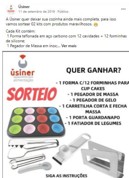
Figura 5 – Posts das redes da empresa

A empresa também realizava sorteios, sempre em datas específicas, como podemos ver abaixo, na figura 5, o sorteio de Natal que a empresa realizou.