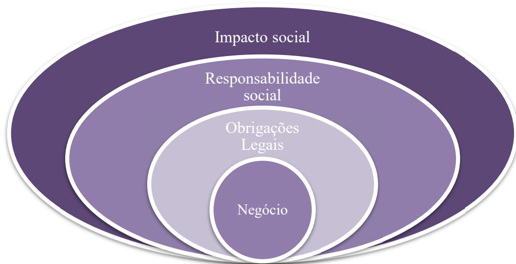
Figura 4 - Abrangência do impacto social