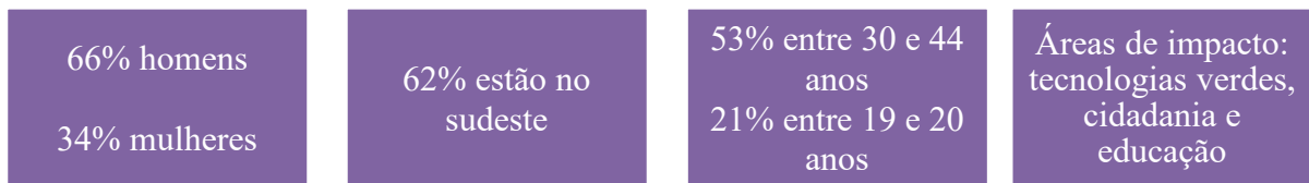
Figura 3 - Características gerais dos empreendedores sociais.

Ambas estão localizadas na região sudeste do Brasil, local onde estão dispostas a maioria das startups do país (ABS, 2019) e o maior número de empreendedores sociais conforme mostra a Figura 3.