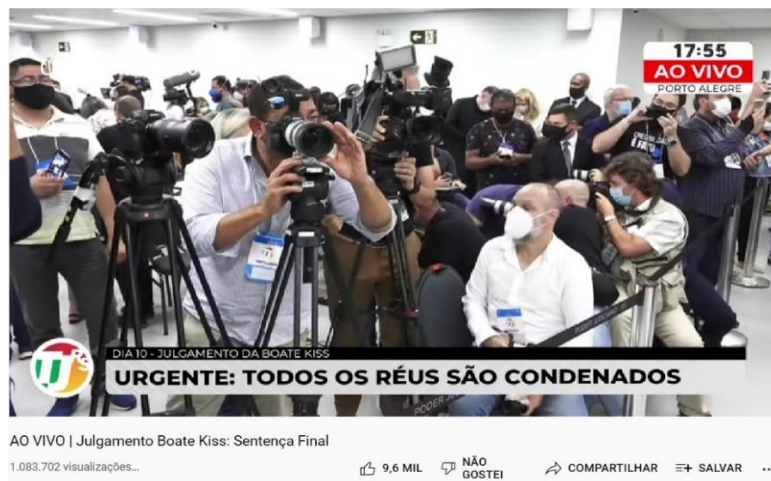
Figura 3 - Caso Boate Kiss - Sentença