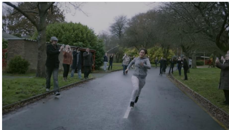
Figura 2 – Perseguição de Victoria e a reação social

Algumas partes do episódio carregam uma forte simbologia acerca do que é denominado por Guy Debord (1967) como Sociedade do Espetáculo, em específico a Figura 2, cena em que Victoria começa a ser perseguida por um homem armado.