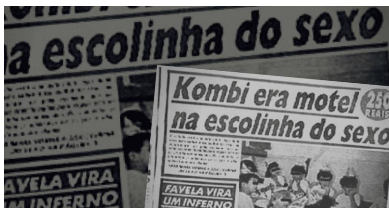
Figura 4 - Caso Escola Base

Ademais, a série guarda uma forte similaridade com a vida real, que pode ser percebida a partir de diversos casos concretos do cotidiano, como por exemplo o Caso Escola Base, que ainda que tenha ocorrido em 1994, onde não havia ainda a explosão da internet nos moldes atuais, sofreu uma forte influência da mídia e que gerou consequências catastróficas aos acusados.