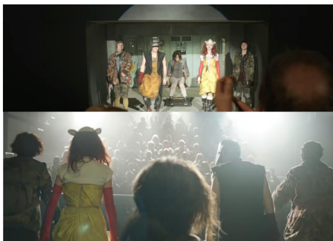
Figura 1 – “Black Mirror”: Episódio “White Bear”

A Figura 1 é retirada do final do episódio, quando a personagem descobre que sua perseguição é, na verdade, um teatro. Após, é explicado os motivos pelos quais ela é submetida a tal forma de punição e é levada de volta para a casa, onde terá sua memória apagada novamente, para que tudo se repita no dia seguinte.