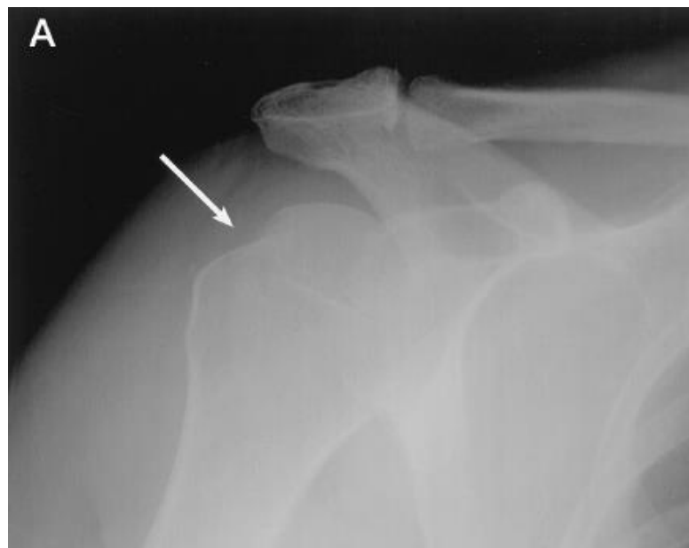
Figura 2 – Incidência AP do ombro na rotação interna de um paciente com histórico de luxação mostrando um defeito de Hill-Sachs (seta)